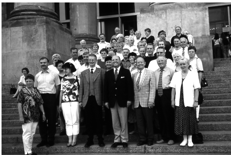
Stadtverband vor dem Reichstag in Berlin Mai 2000