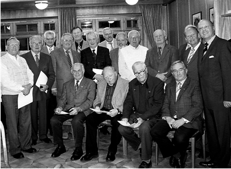
2004: Jubilare des CDU Stadtverbandes Oberkochen