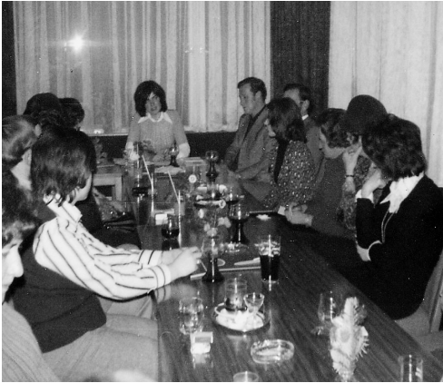
1973 bei der Gründungsversammlung „Frau und Politik“ im Cafe „Weidl“