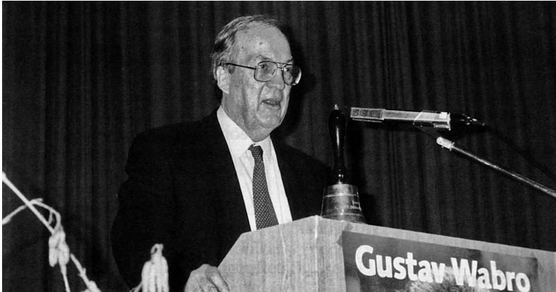
1996: Manfred Rommel, Oberbürgermeister a.D. der Stadt Stuttgart