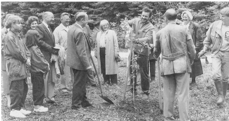
Pflanzung der CDU-Eiche am 03.10.1990 – Tag der Deutschen Einheit