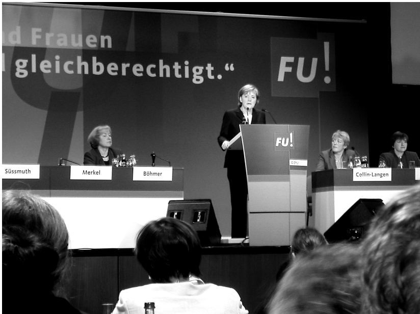
12.11.2005: Bundeskanzlerin Frau Dr. Angela Merkel beim Bundesdelegiertentag in Ludwigsburg