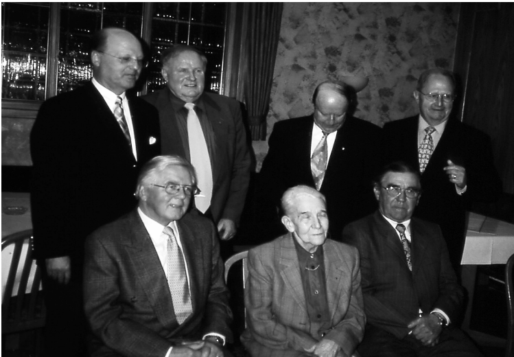
2001: CDU Oberkochen - Jubilare