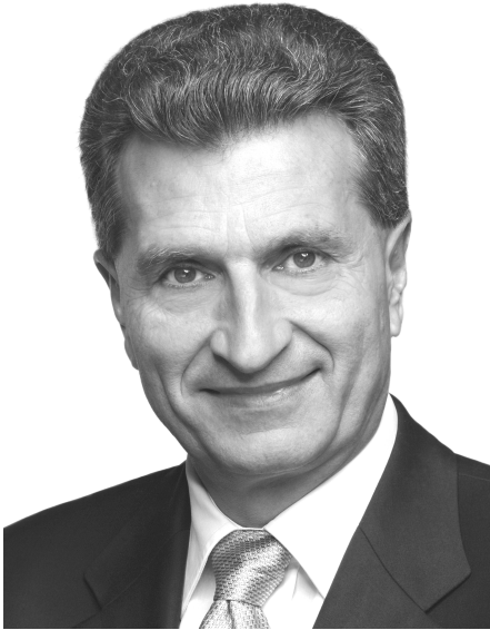
Grußwort von Ministerpräsident Günther H. Oettinger, MdL CDU-Landesvorsitzender

Sehr geehrte Damen und Herren, liebe Freundinnen und Freunde,